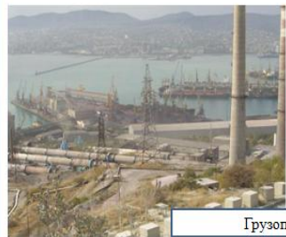
Грузопоток в порт