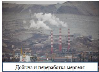
Добыча и переработка мергеля

Цель работы: продвижение идей сбора и сдачи в переработку макулатуры и привлечение внимания к проблемам раздельного сбора отходов, извлекая при этом экономическую выгоду